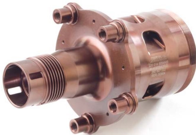
Komplexe Geometrien kennzeichnen Einzelteile wie Systeme von Pankl Racing wie diese Radnabe aus dem Bereich der Fahrwerkskomponenten ...

„Seit Einführung von NX und Teamcenter erlebte das Unternehmen ein signifikantes Wachstum.“