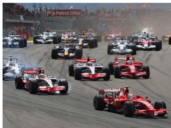
Auch aber nicht nur in allen Werks-Fahrzeugen der Formel 1 arbeiten im Automobil-Rennsport Fahrwerkskomponenten, Pleuel und Kurbeltriebe von Pankl.

Etwa 50 Konstrukteure aus verschiedenen Nationen bilden ein professionelles, dynamisches Team, das aus einem enormen Erfahrungsschatz schöpft und