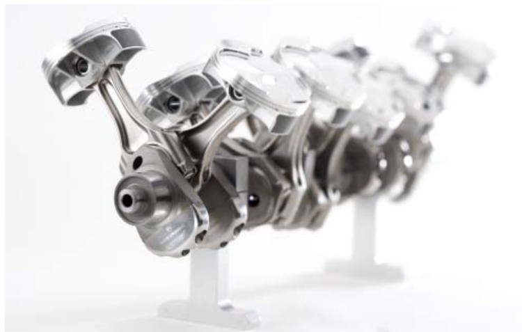
... ebenso wie die Kolben und Pleuel aus dem Motor-Bereich

Ständig steigende Geschwindigkeits- und Qualitätsansprüche erfordern, dass sich die Konstrukteure bei Pankl auf ihre Aufgaben konzentrieren können. Technologische Ablenkungen und Störungen können wesentliche, zeitraubende Umwege verursachen. Die Techniker arbeiten daher mit computerunterstützten Technologien (CAx), die voll auf ihre Bedürfnisse abgestimmt sind und erhalten dabei exzellente IT-Unterstützung. Laut Anwendern bei Pankl verfügt die interne IT-Abteilung über außergewöhnlich große Erfahrung in CAD und CAM, deutlich mehr als IT-Abteilungen in vielen anderen Unternehmen. Die Unterstützung beinhaltet ständige technologische Beurteilungen und Bewertungen.